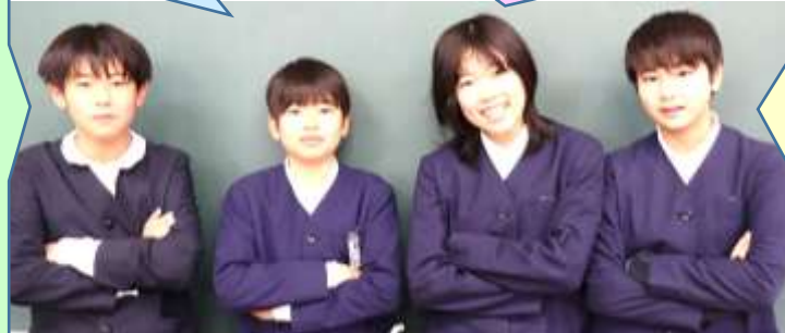
やりきった充実感か、表情に余裕がある6年生4人

児童会の役員になった日から、みなさんの学校生活が楽しくなるように努力してきました。皆さん、毎日、楽しく学校で過ごせていますか。僕がそのお手伝いを少しでもできていたら、とても良かったと思ひます。僕自身もこの一年成長できたと思ひます。人との接し方、人前での話し方などたくさんあります。5年生の児童会の人にも児童会の仕事を通して、精一杯頑張ってください。一年間ありがとうございました。