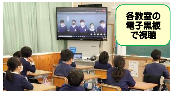
各教室の電子黒板で視聴